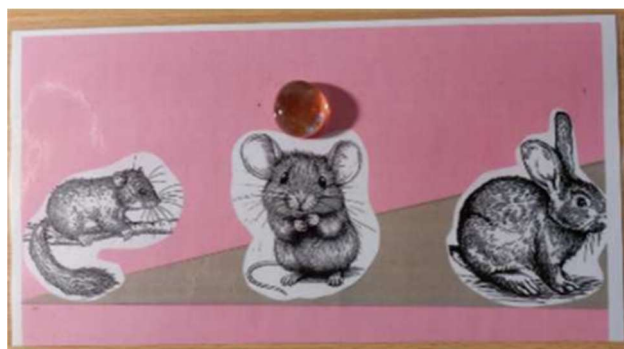
Abbildung 1 und 2: Erste Einschätzung nach dem Input mit Tierbildern. Die Tiere haben unterschiedlich grosse Ohren.