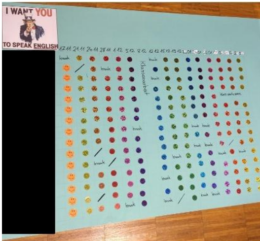
Abb. 1: Sticker-Plakat dokumentiert das Sprechen in der Zielsprache