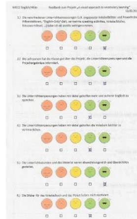
Abb. 2: Selbsteinschätzung der SuS zum Gewinn des Projekts