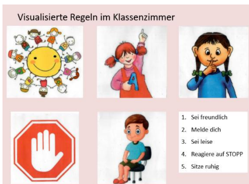
Abb. 4: Visualisierte, nonverbale Regeln, welche im Klassenzimmer aufgehängt den SuS als Erinnerungsanker dienen.