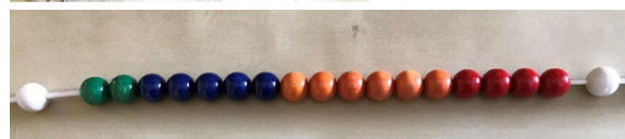
Abbildung 2: Ergebnis einer Datenerhebung

Anwesende SuS: 17 Rot: 4 Orange: 6 Blau: 5 Grün: 2