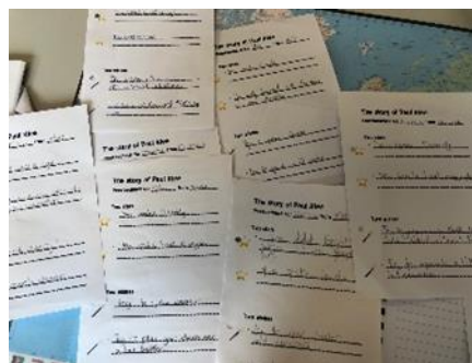
Beispiele von «Two starts – Two wishes»